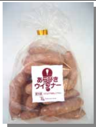
! あらびきウインナー(ホワイト)